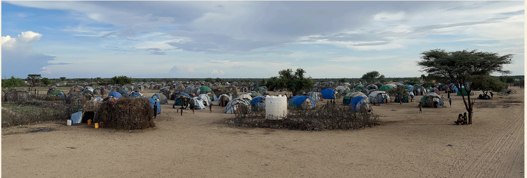
Une partie du camp de réfugiés Dassanesh.

De concert avec les communautés touchées, ce lieu a été déterminé par les autorités puisqu'il se situe sur une zone surélevée qui n'est pas sujette aux inondations dans le court terme, ainsi que dans le futur. La présence des communautés en ce lieu y sera donc pérenne, facteur central pour un projet d'infrastructure comme nous projetons de réaliser.