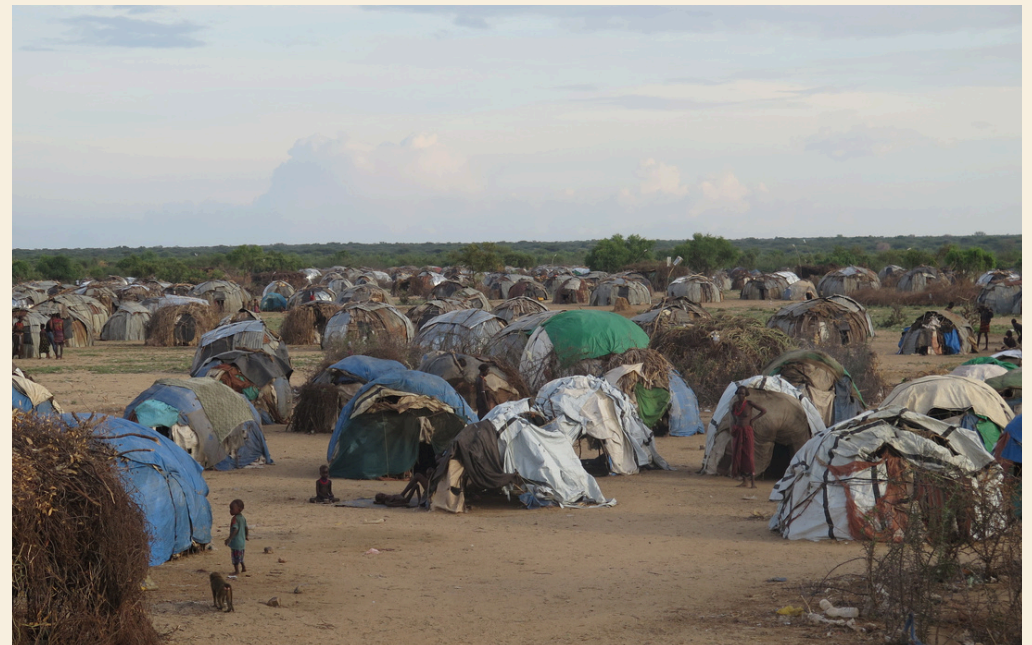
Une partie du camp de réfugiés.