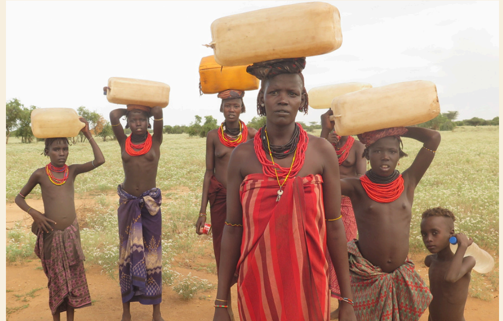
Femmes et enfants issus du camp de réfugiés.

Présents sur place au printemps 2024, les membres de For Equity, notre coordinateur de terrain ainsi que des membres des autorités locales, ont pu déterminer cet extrême degré de nécessité et l'importance majeure d'une source d'eau propre pour la santé de ces populations, et même plus simplement pour leur qualité de vie déjà éprouvante.